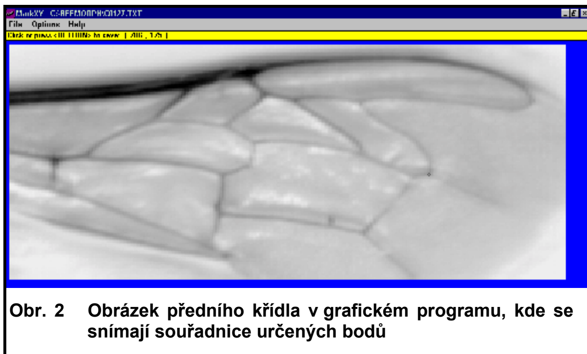
Obr. 2 Obrázek předního křídla v grafickém programu, kde se snímají souřadnice určených bodů